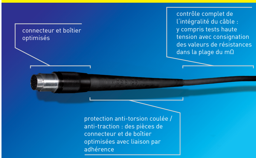
Câble après réparation BEIER™ :