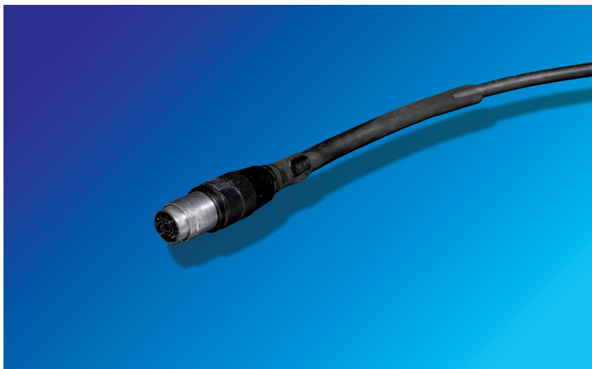
Câble défectueux avant réparation

Vous recevez les câbles réparés et transformés en fonction de vos besoins individuels en général dans un délai de quelques jours.