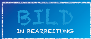
BEIER™ 120° Swivel für BOSCH ECH