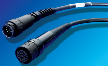
BEIER™ Regular für BOSCH ECH