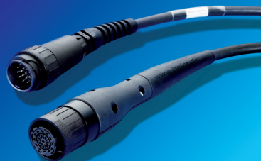
BEIER™ Swivel für BOSCH ECH