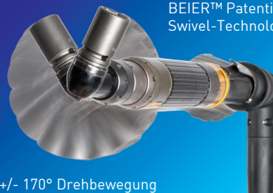
BEIER™ Patentierte Swivel-Technologie