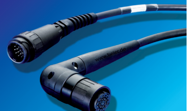
BEIER™ 90° Swivel für BOSCH ECH