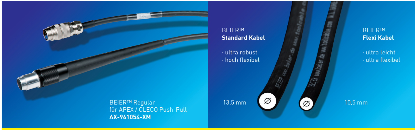
BEIER™ Regular für APEX / CLECO Push-Pull AX-961054-XM