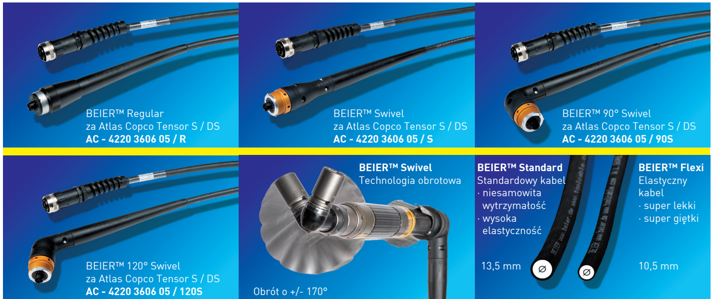
BEIER™ Regular za Atlas Copco Tensor S / DS AC - 4220 3606 05 / R

4220 3606 XX / 4220 0982 XX / 4220 1491 XX / 4220 1560 XX / 4220 1845 XX / 4220 4129 XX / 4220 1616 XX / 4220 4380 XX / 4220 4817 XX